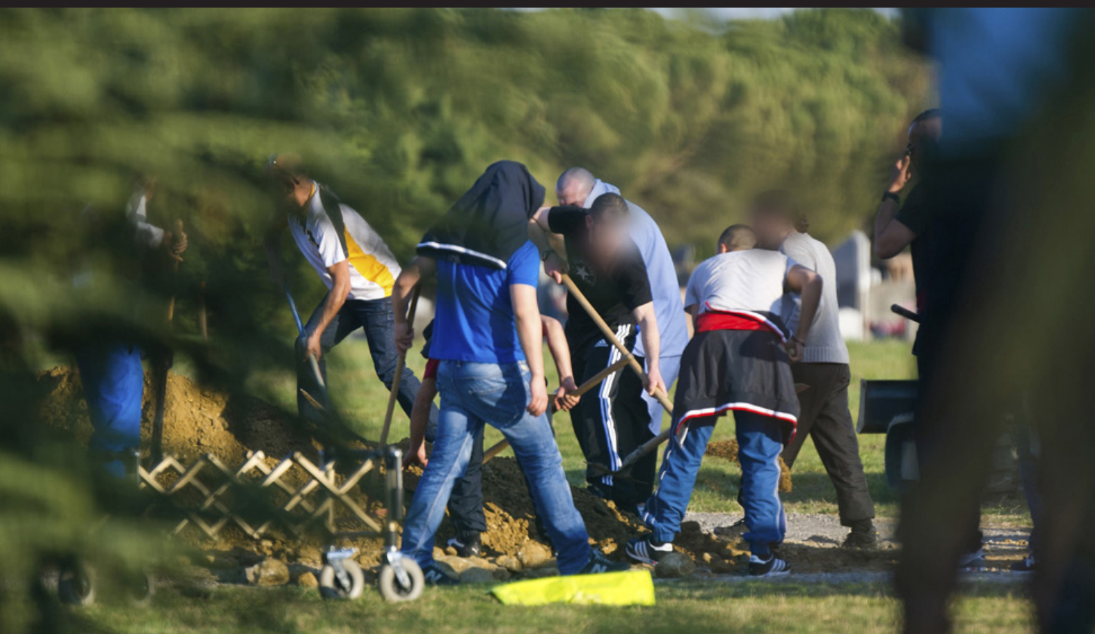
L'enterrement de Mouhammad Merah (qu'Allâh lui fasse Miséricorde)