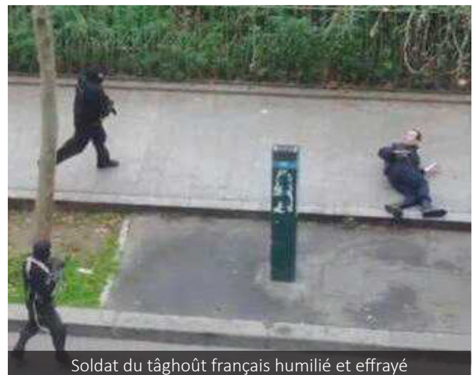
Soldat du tâghoût français humilié et effrayé

Ce torchon maudit qu'est Charlie Hebdo s'est moqué plus d'une fois du Messie Jésus et de sa mère, Marie, qu'ont fait les chrétiens qui prétendent aimer le Messie et sa mère jusqu'à les adorer en dehors d'Allâh ? Rien ! Les juifs dans leur Talmud les insultent de la pire manière. Comment les chrétiens, en France et ailleurs peuvent accepter d'être gouverné par cette bande de vipères, nous appelons les chrétiens à ne plus accepter la domination juive et à accepter la seule religion qui défend les choses sacrées, la religion de tout les prophètes, la seule religion de vérité : l'Islâm .